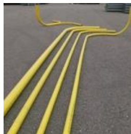
Invoerbocht lange lengtes tot 14 meter