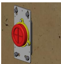
RVS door fundering, Diverse mogelijkheden