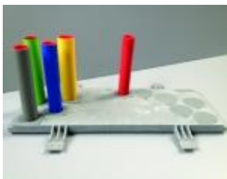
Woningbouw G/E/W/C/T KOMO, met of zonder isolatie