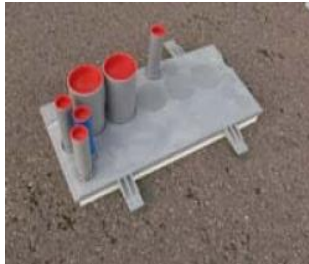
Woningbouw WARMTE KOMO, met/zonder isolatie