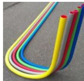
Invoerbochten met Sprong of S-bocht