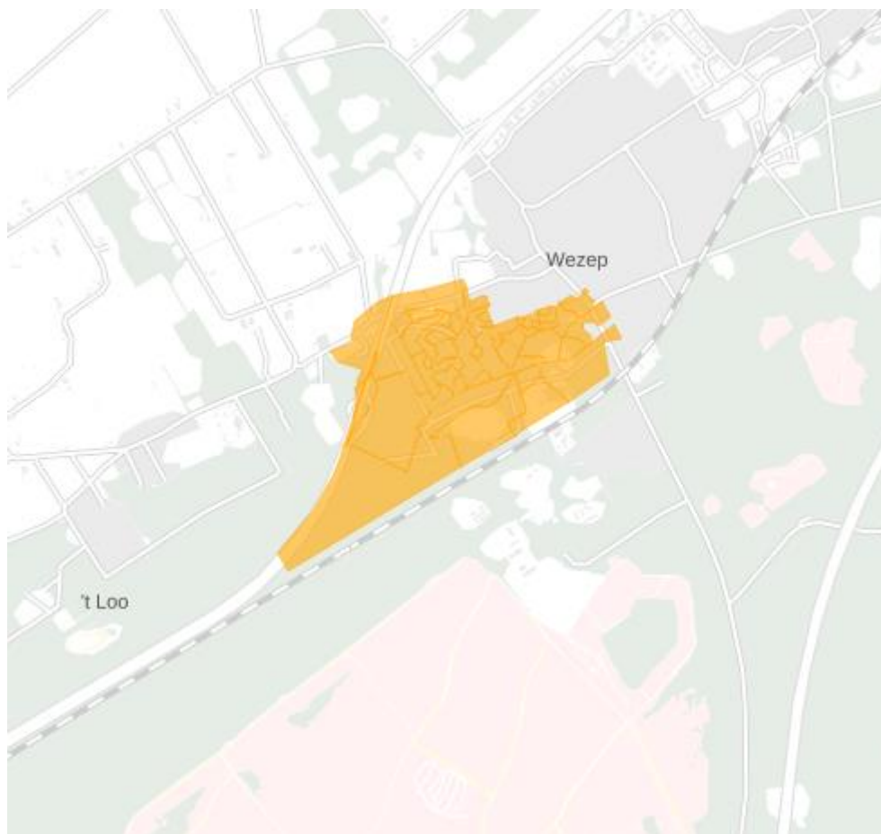
Figuur 3: Kaart van het congestiegebied.

Het congestiegebied staat weergegeven in de kaart en de lijst met postcodegebieden hieronder.