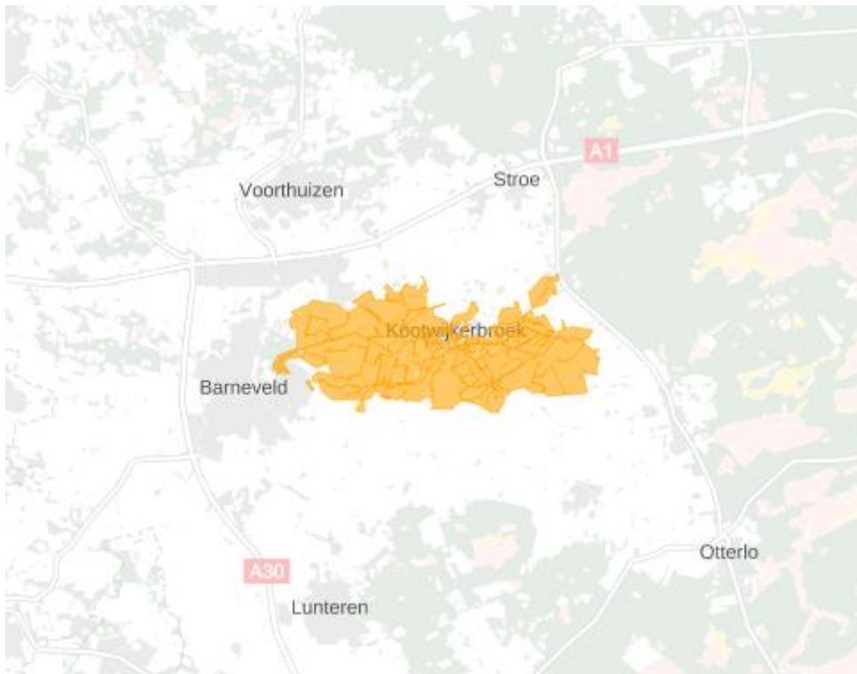
Figuur 3: Kaart van het congestiegebied.