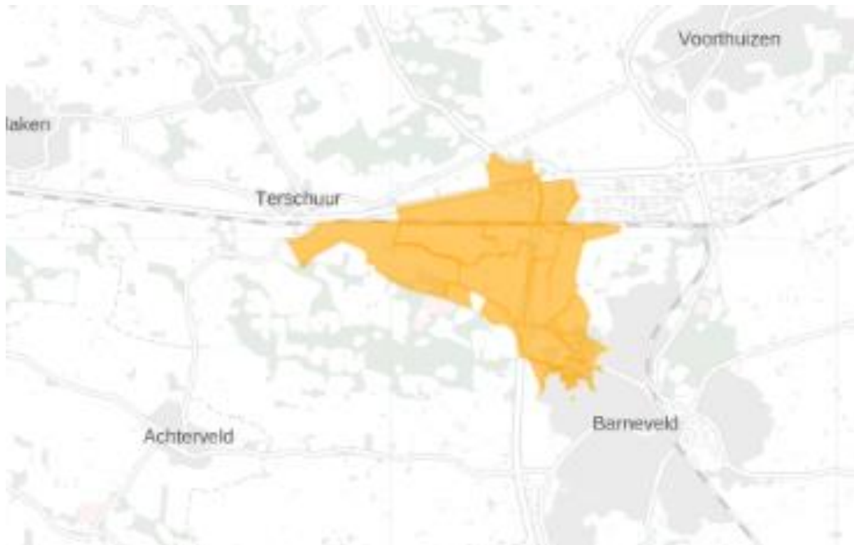
Figuur 2: Kaart van het congestiegebied.

Het congestiegebied staat weergegeven in de kaart en de lijst met postcodegebieden hieronder.