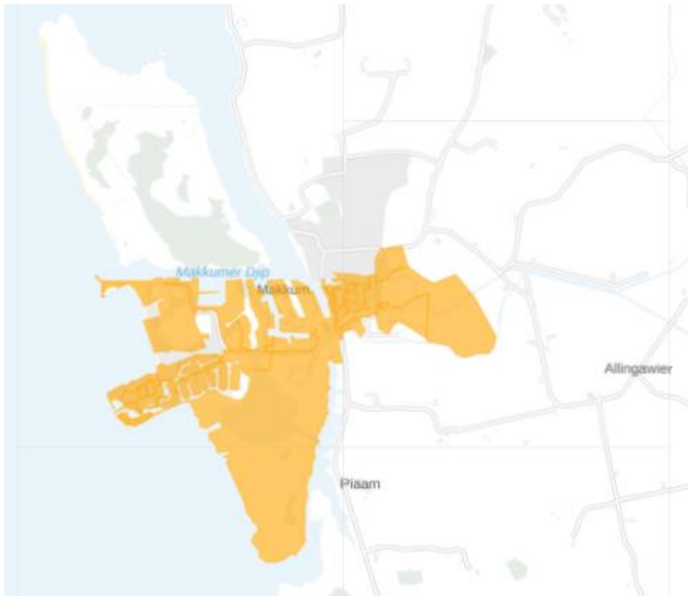
Figuur 1: Kaart van het congestiegebied.

Het congestiegebied staat weergegeven in de kaart en de lijst met postcodegebieden hieronder.