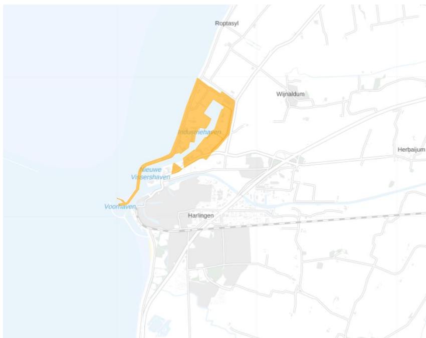
Figuur 1: Kaart van het congestiegebied.

Het congestiegebied staat weergegeven in de kaart en de lijst met postcodegebieden hieronder.