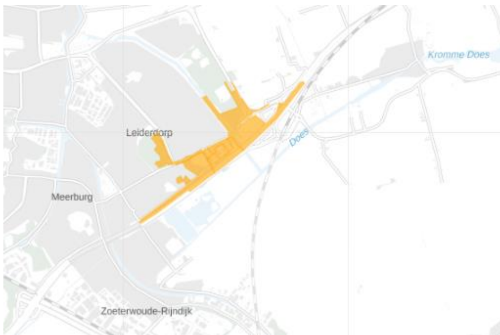
Figuur 3: Kaart van het congestiegebied.

Het congestiegebied staat weergegeven in de kaart en de lijst met postcodegebieden hieronder.