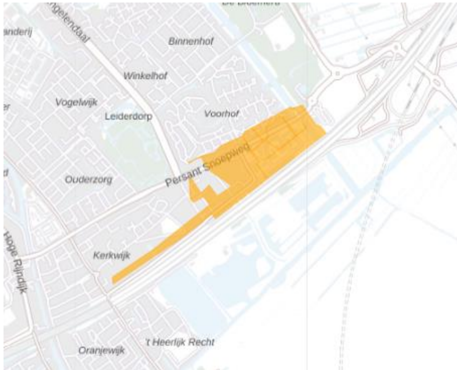
Figuur 2: Kaart van het congestiegebied.