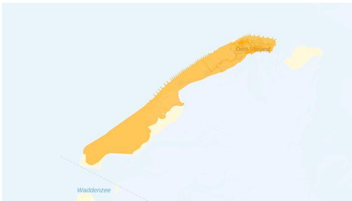
Figuur 2: Kaart van het congestiegebied.

Het congestiegebied staat weergegeven in de kaart en de lijst met postcodegebieden hieronder.