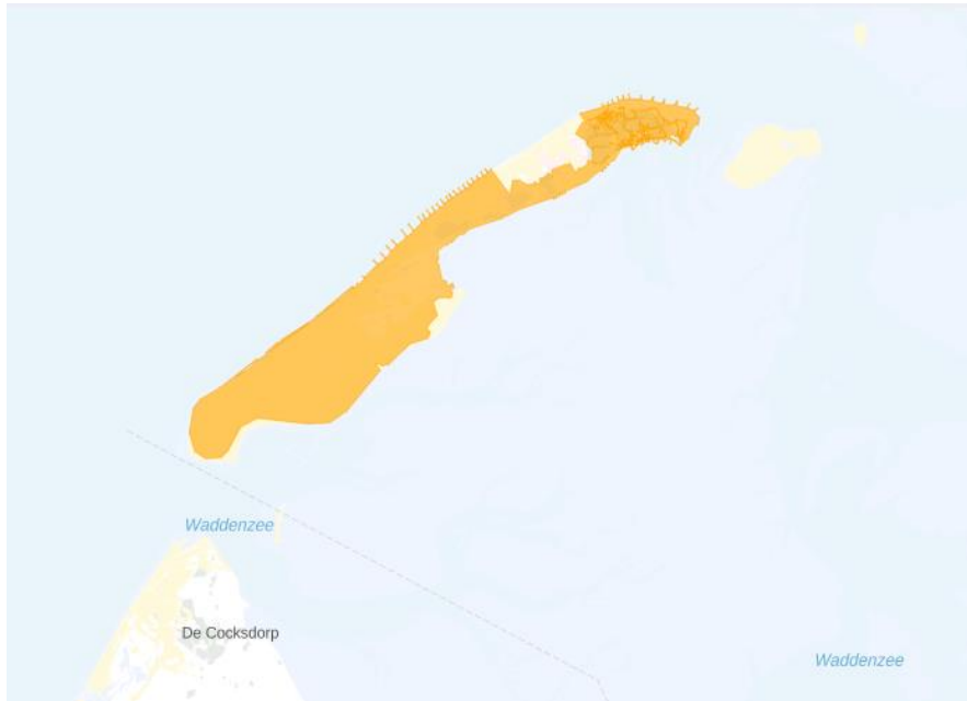
Figuur 3: Kaart van het congestiegebied.