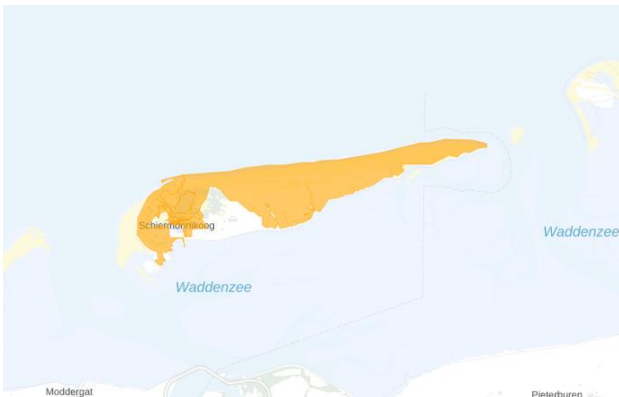
Figuur 2: Kaart van het congestiegebied.

Het congestiegebied staat weergegeven in de kaart en de lijst met postcodegebieden hieronder.