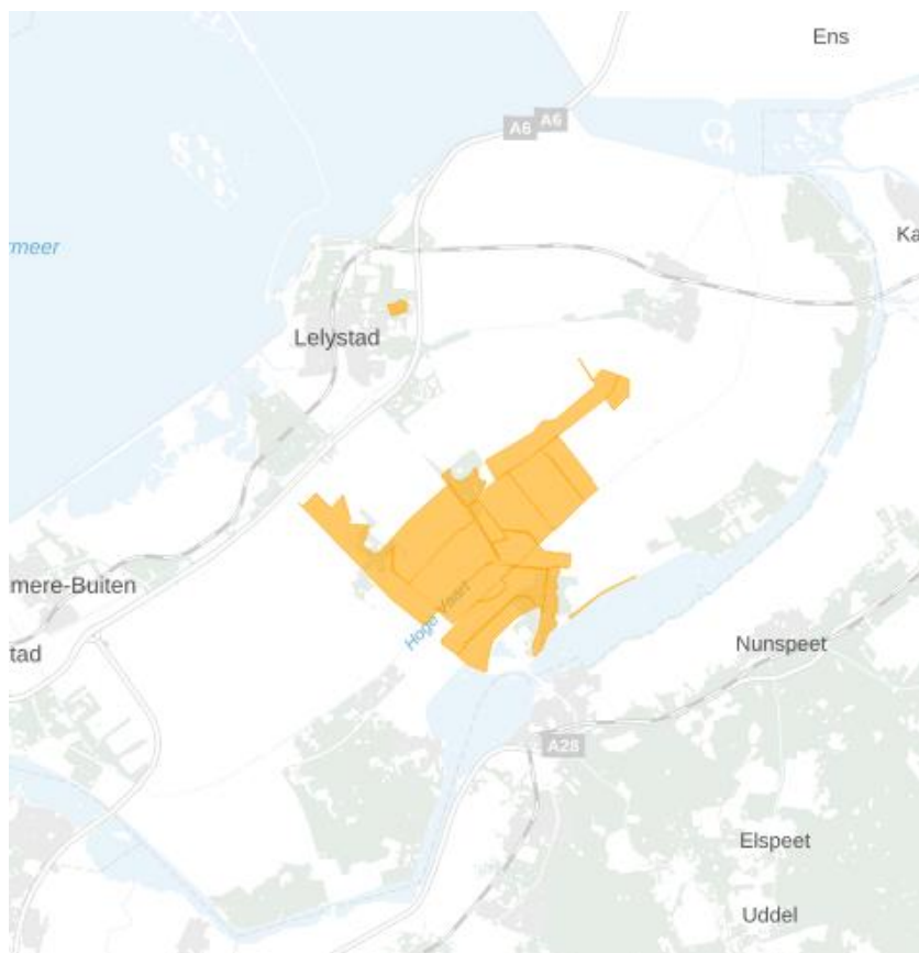
Figuur 1: Kaart van het congestiegebied.