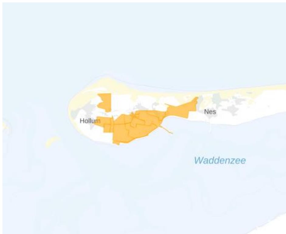
Figuur 2: Kaart van het congestiegebied.

Het congestiegebied staat weergegeven in de kaart en de lijst met postcodegebieden hieronder.